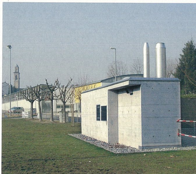
La parte esterna della centrale termica a cippato di Coldrerio.

La centrale termica è situata tra la scuola dell'infanzia ed il campo di calcio e, a parte il vano di accesso, è completamente interrata e invisibile dall'esterno. La zona è caratterizzata da un facile accesso e si trova in posizione centrale rispetto agli stabili comunali da riscaldare. Essa è composta da una caldaia a cippato completamente automatica di 550 kW, abbinata ad una caldaia a gas da 126 kW. La caldaia a gas, precedentemente impiegata quale riscaldamento delle scuole dell'infanzia, copre le punte di fabbisogno termico ed i periodi con basso consumo. La caldaia a cippato, affiancata da un filtro elettrostatico per l'abbattimento delle polveri ben oltre i limiti di legge, è in grado di utilizzare combustibile con un alto tenore di acqua (fino al 60%). Si ipotizza pure un parziale impiego della parte legnosa derivante dalla raccolta del verde urbano. L'approvvigionamento di cippato è messo a concorso tra le aziende ed imprese forestali della zona.