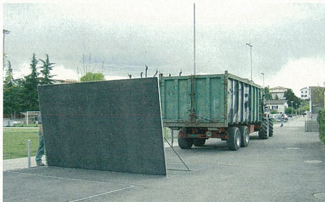
La fornitura di cippato, rapida e pratica grazie al silo interrato.

Il Comune di Coldrerio ha sfruttato al meglio l'esigenza di sostituire gli impianti di riscaldamento di differenti stabili pubblici, optando per una centrale di quartiere che produce gran parte del calore grazie al cippato di legna, una risorsa energetica rinnovabile e indigena, disponibile sul posto in grandi quantità. Malgrado la presenza della rete del gas e l'investimento iniziale più alto, Coldrerio ha così dimostrato lungimiranza. Tanto più se si considera la sicurezza di approvvigionamento energetico e la convenienza del prezzo del cippato, nonché la necessità di ridurre la dipendenza dai vettori energetici fossili.