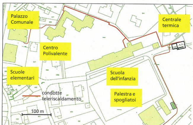
La rete di riscaldamento del Comune di Coldrerio.