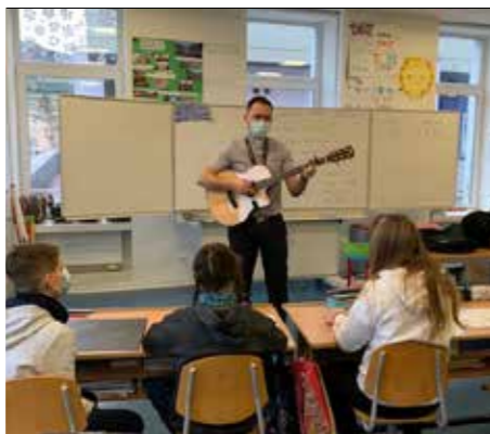
Don Paolo con gli allievi di quinta elementare.

Non tanto, come a mio fratello gemello. Mi capita ogni tanto di comprare qualche dolce, ma come ho già