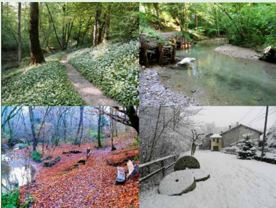
Le quattro stagioni nel Parco Valle della Motta.

biamo avere uno sguardo sereno sul fluire di tutte le cose. E però molto importante essere consapevoli che non dobbiamo rassegnarci ad essere in balia impotente degli eventi; specialmente per quel che riguarda la nostra persona; per esempio, la salute fisica e mentale passa attraverso la cura che abbiamo del nostro corpo. In sintesi, una vita condotta in modo equilibrata e sana rappresenta una buona possibilità di invecchiare in salute. Pur rimanendo consapevoli che la giovinezza sarà comunque destinata a tramutarsi in vecchiaia.