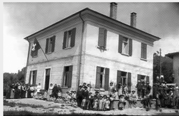
Le scuole comunali di Coldrerio ad inizio '900

dice spesso, dagli investimenti sulle giovani generazioni, che persone istruite e formate siano comunque un primo essenziale passo per sperare "ogni bene". E su questo è difficile che persone ra-